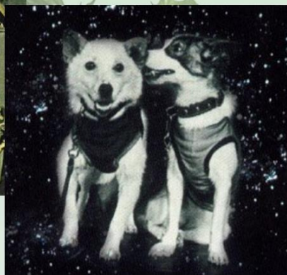
БЕЛКА И СТРЕЛКА

Чтобы узнать, с чем человеку придется столкнуться в космосе, ученые отправляли на «разведку» животных. Это были собаки, кролики, мыши, даже микробы.